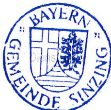
Patrick Grossmann Erster Bürgermeister

Sinzing, 11. September 2017 Gemeinde Sinzing